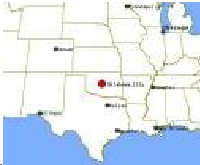
Oklahoma City, Oklahoma